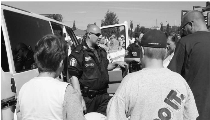
◀ Paikalla oli myös poliisiauto, paloauto, ambulanssi ja ratsupoliisi - kaikki takuuvarmoja yleisömagneetteja eritoten lasten silmissä.